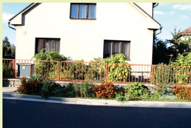
Předzahrádka v Tylově ulici v Uhlířských Janovicích