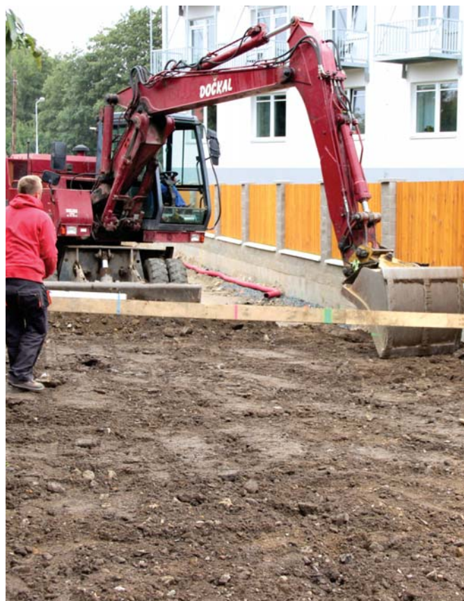
Foto z rekonstrukce ulic Mánesova a Topolová, kterou provádí pracovníci firmy SILMEX. Na snímcích probíhají práce na osazování obrubníků (Mánesova) a vyrovnávka podkladních vrstvy konstrukce vozovky (Topolová).