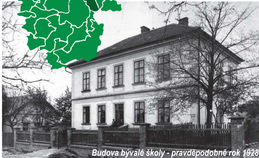
Budova bývalé školy - pravděpodobně rok 1928

V Rašovicích byla obnovena funkčnost Dubinského rybníka, tzn. odbahnění, provedení sta-