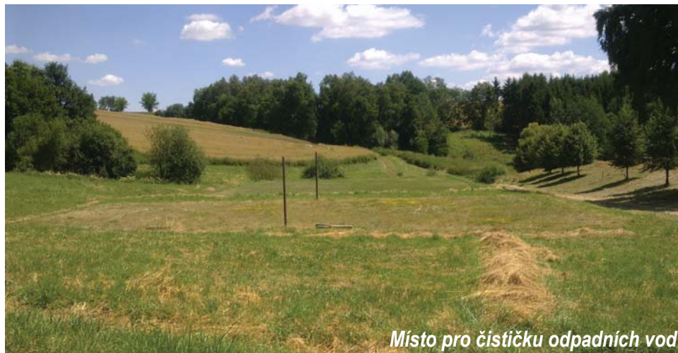
Místo pro čističku odpadních vod