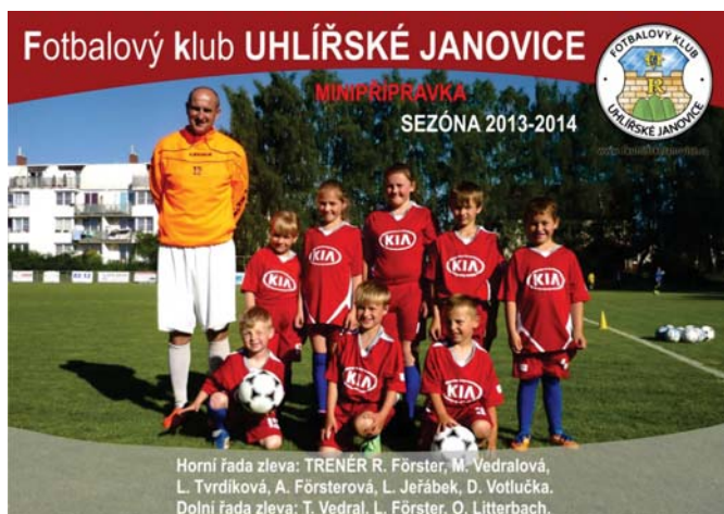
Minipřípravka FK Uhlířských Janovic