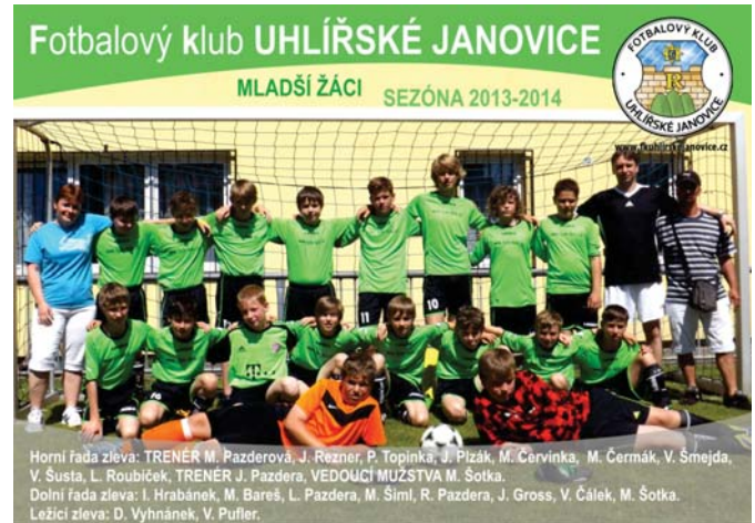
Mladší žáci FK Uhlířských Janovic