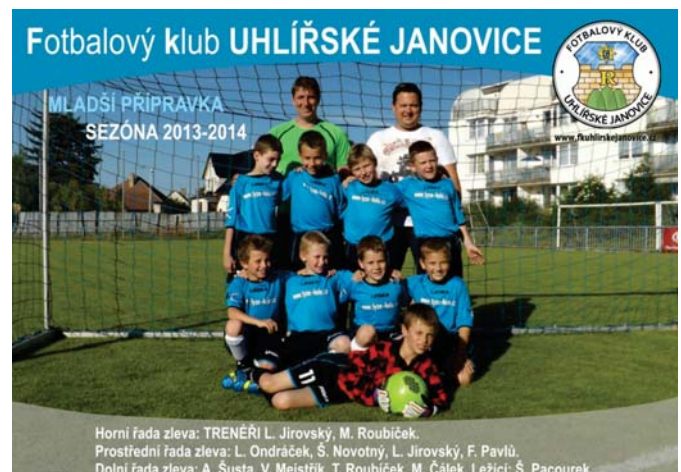
Mladší přípravka FK Uhlířských Janovic