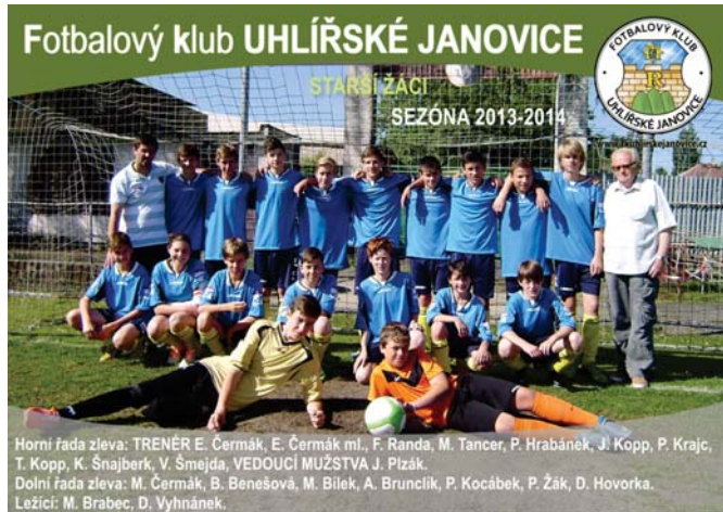
Starší žáci FK Uhlířských Janovic