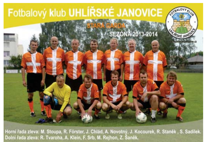
Stará garda FK Uhlířských Janovic