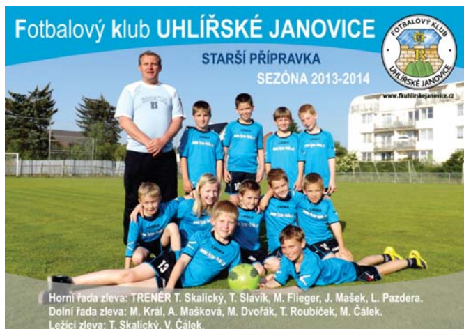
Starší přípravka FK Uhlířských Janovic