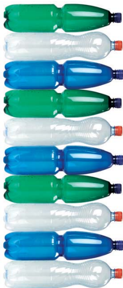
nesešlapané PET lahve 10 ks