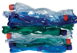
sešlapané PET lahve 10 ks