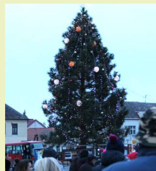
Rozsvícení vánočního stromu 30. 11. na Václavském nám.