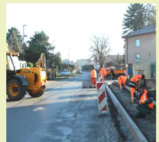
Pracovníci firmy SILMEX, s.r.o., při rekonstrukci chodníku ve Smetanově ulici.