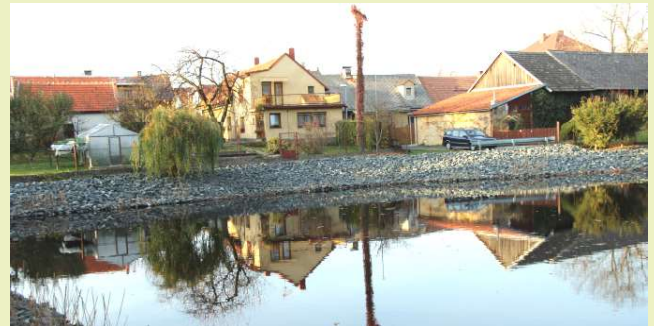
Pohled na nádrž Holoubek po napuštění.