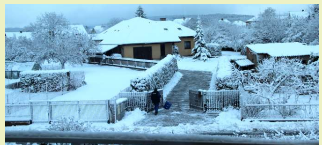
Ráno 12. 12. 2018 po nečekané sněhové nadílce.